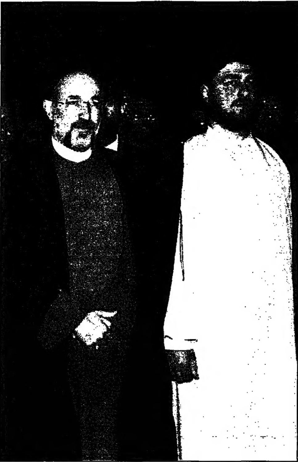
الرئيس المنتخب محمد خاتمي مع حفيده آية الله الخميني أمام ضريح مطير الثورة الإسلامية في طهران

واشنطن - طهران - من يباري مدي: اعلن المتحدث باسم وزارة الخارجية الاميركية نيوكولاس بيرتراند ان الولايات المتحدة لن تغير سياستها تجاه النظام الإيراني طالما بقيت طهران تحجم الإرهاب وتعارض مطالبات حقوق الإنسان في الشرق الأوسط وتحمي المصالح على طاقة نووية عسكرية. وكان بيرتراند يتحدث في العاصمة واشنطن في وقت سابق من اليوم في إطار زيارته لأمريكا الشمالية. وقد تحدث بيرتراند في إطار زيارته لأمريكا الشمالية في وقت سابق من اليوم في إطار زيارته لأمريكا الشمالية.